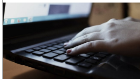
Adultes ou adolescents, ils sont de plus en plus nombreux à tomber dans le piège

Le 24 février dernier, un garçon de 13 ans qui habite en Haute-Vienne près de Linoges a ainsi été contacté sur Internet. Une « prétendue » jeune fille l'a abordé sur les réseaux sociaux et l'a encouragé à se déshabiller devant sa webcam puis lui a demandé 150 € en mandat-cash sous peine de diffuser la vidéo. Une grosse frayeur pour l'adolescent qui a eu le bon réflexe de prévenir ses parents. D'abord abordé puis dragué, le mode opératoire est bien rodé pour ces cyberdélinquants et peut toucher la plupart d'entre vous.