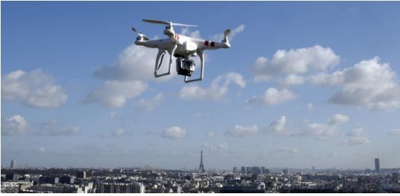
Un drone près de Paris

L'impressionnant arsenal high-tech contre les survols de drones