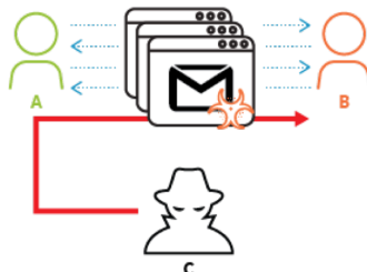
Conversation détournée pour diffuser des logiciels malveillants

Des attaques utilisant cette technique ont permis d'infiltrer plusieurs réseaux, y compris ceux d'une banque du Moyen-Orient, des entreprises européennes de services relatifs à la propriété intellectuelle, une organisation sportive internationale et des « individus ayant des liens indirects avec un pays de l'Asie du Nord-Est. » Les chercheurs de Palo Alto ont expliqué qu'en cas de succès, le document malveillant télécharge deux charges utiles malveillantes : PooMilk et Freenki. [lire la suite]